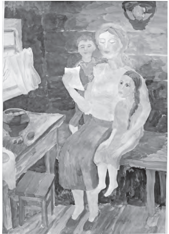
«Письмо с фронта», рисунок Александры ЛАБЗЕНКО.

А от любимой нет вестей из дома, Там враг, и боли в сердце не унять. Как взрыв письмо: «Твои пропали, Угнали в плен, не можем отыскать».