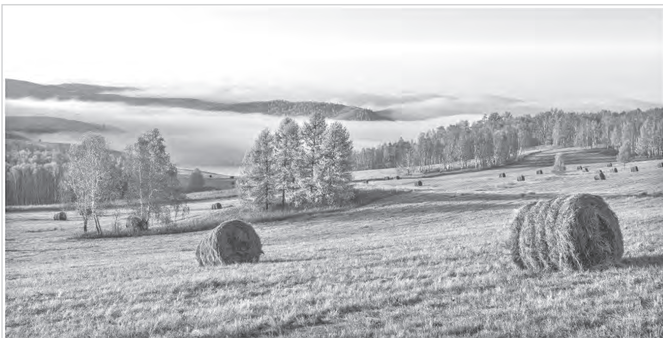
«Позолотило листья бабье лето. Над головой – бездонная лазурь!»