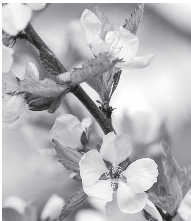
«Красавица сибирская – ранетка – в наряде белом смотрит со двора».

Друзья мои, я вас люблю. Прошу, пишите мне почаще. Любую боль перетерплю, Но не пустой почтовый ящик!