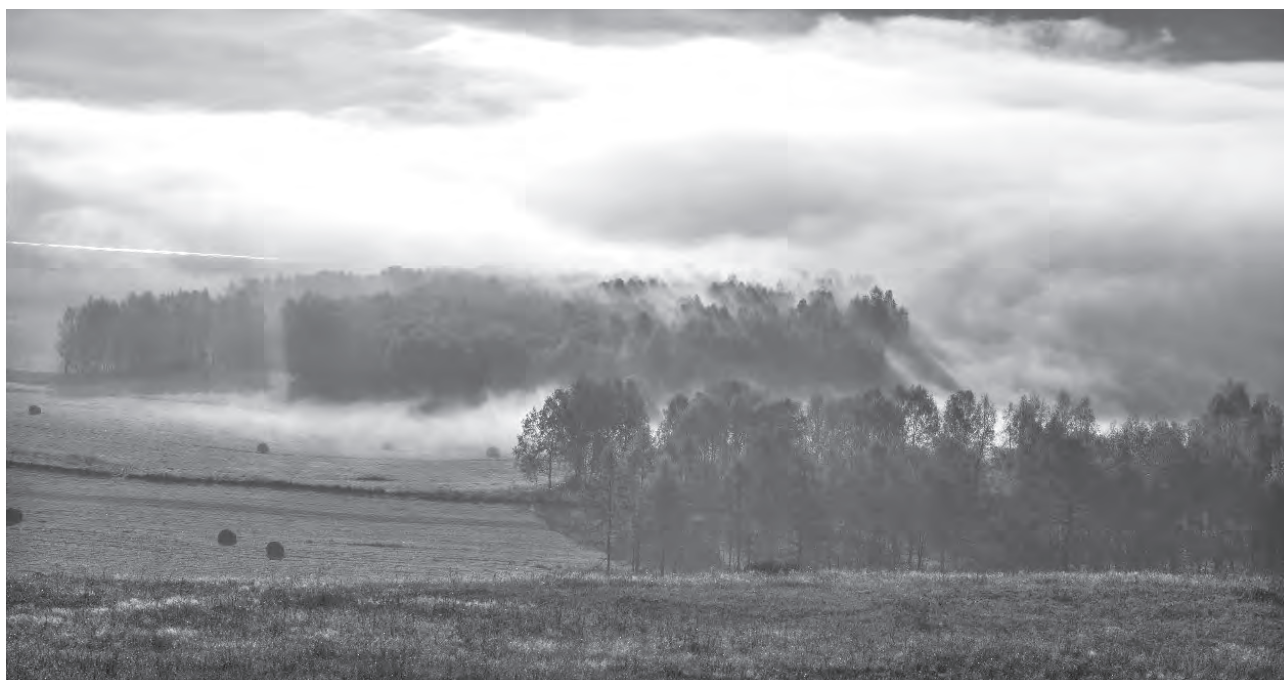
«А за полем, по кромке сна, проплывает туман седой».

Я услышал подавленный стон Вновь проигранной внутренней битвы И немое терзанье икон, Жаль, не мне посвящённой молитвы.