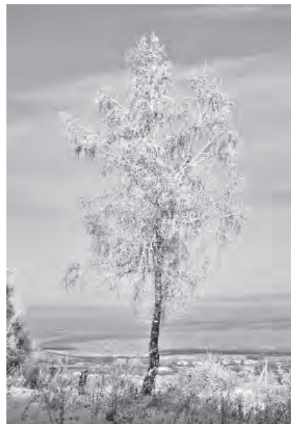
«Затуманились морозом, в хоровод зовут берёзы».

Эти дивные дали И глубины седые... Что придумали сами, Когда были святыми.