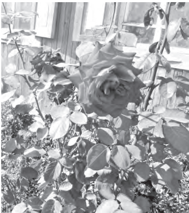
«Принеси мне букет цветов, да чтоб розы алые-алые».

Возьми новый холст и новые краски И напиши, чтобы было как в сказке. Творцом у мольберта выступи ты, Создай вновь пейзаж неземной красоты!